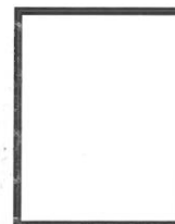
Huella Digital (índice derecho)

Nota: Cualquier falta u omisión será causa de procedencia a las acciones administrativas, civiles y/o penales a que hubiere lugar.